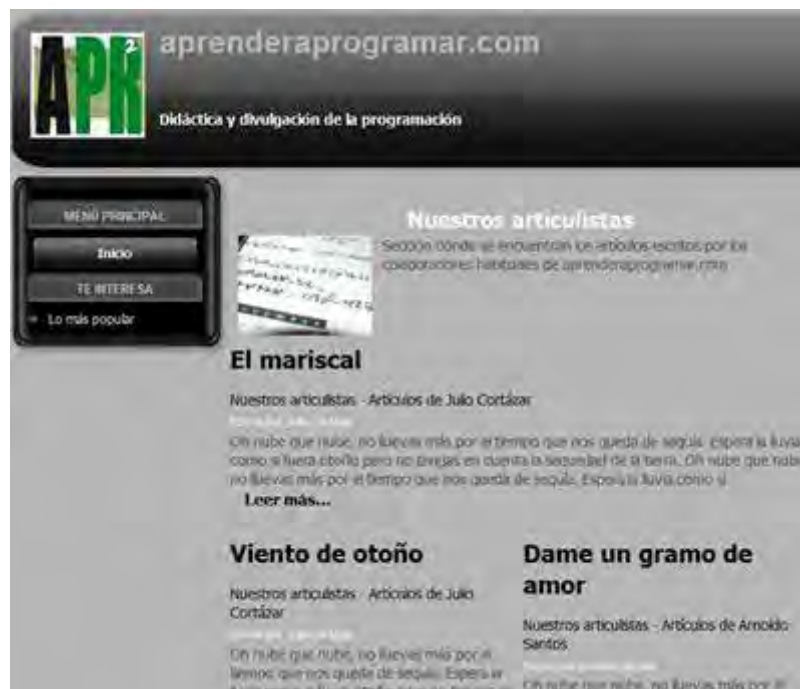
Un artículo principal a todo lo ancho y dos columnas, formato blog.